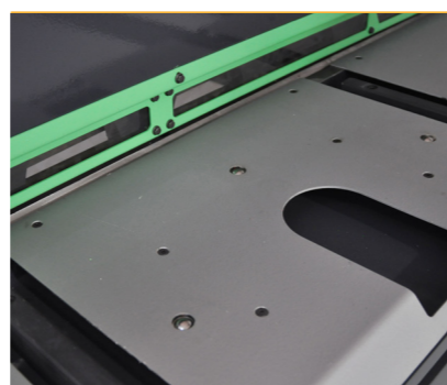
Table with rollers for easy handling of even the heaviest sheets (except on 2500/25 & 3000/20 models).