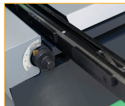
Squaring arm with T-slot, mm scale and tilt stop. Easy front adjustment of the blade gap for different material thicknesses.