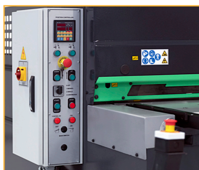
Easy setting of the motorised back-gauge, and cut-piece counter from the front of the machine.